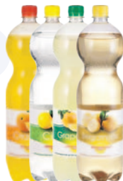
Pilatus Orange, Citro, Grapefruit & Bergamotte 6 x 150 cl