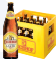
Eichhof Lager Lager 20 x 50 cl